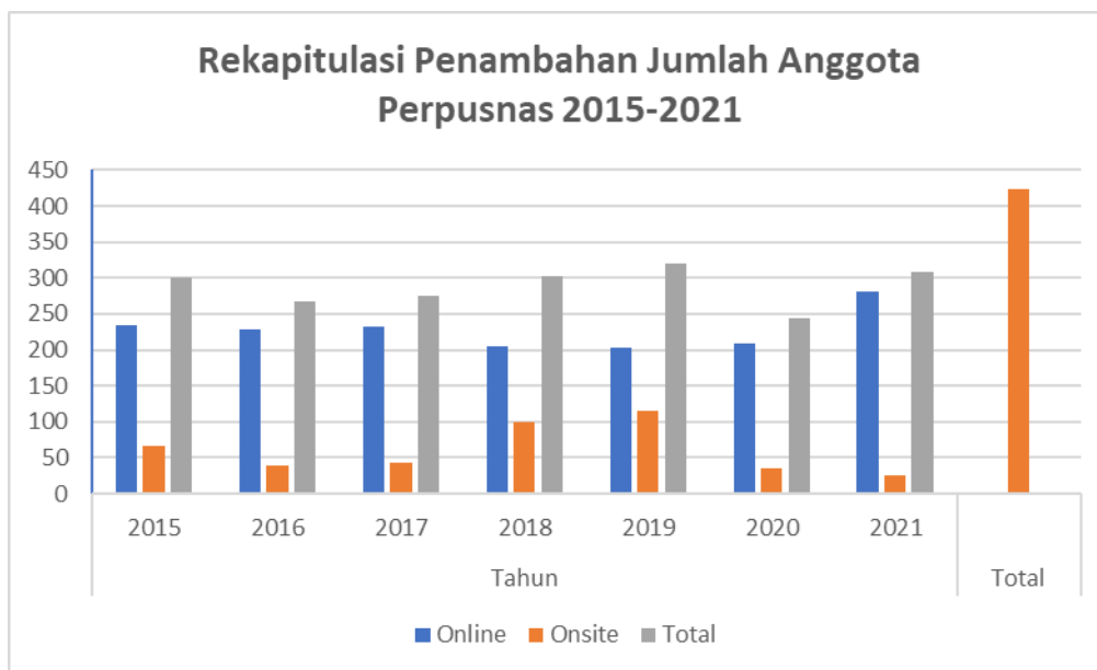
Gambar 1. Daftar Pengunjung Perpustakaan Nasional RI

Unggahan di atas adalah data yang di dapatkan langsung dari Perpustakaan Nasional RI, pendaftaran secara online adalah pengunjung yang mendaftarkan diri secara online melalui link yang sudah tersedia di website Perpustakaan Nasional, dan untuk onsite adalah pengunjung yang mendaftar langsung di perpustakaan nasional. Di lihat dari data penambahan anggota Perpunas mengalami penurunan di tahun 2018-2020 dan mulai meningkat Kembali di tahun 2020-2021.