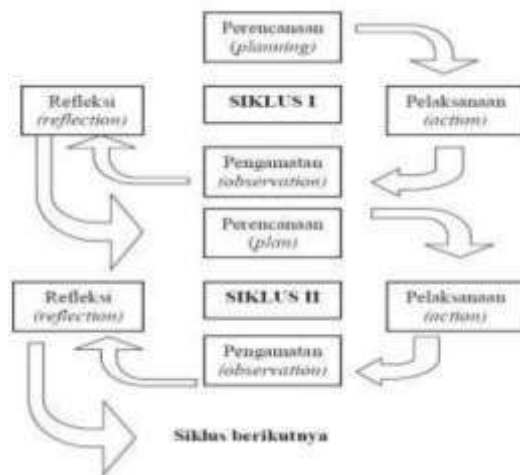
Gambar 1. Prosedur Penelitian diadaptasi dari Kemmis dan Taggart (2012)

Prosedur yang digunakan dalam penelitian ini diadaptasi dari Kemmis dan Taggart (2012) yang mempunyai empat tahapan, antara lain : planning (perencanaan), action (tindakan), observation (pengamatan), dan reflection (refleksi) dan diterapkan dalam dua siklus.