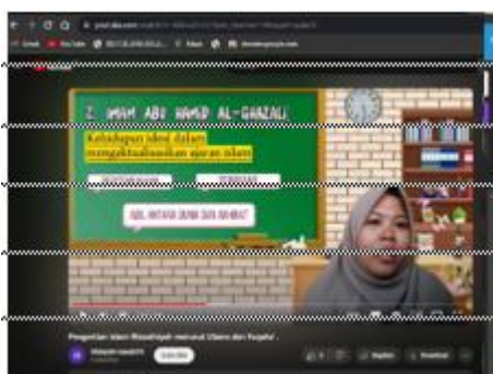
Gambar 4. Tampilan Video Pembelajaran Menggunakan Youtube

Fitur tambahan ini berupa kode QR yang terdapat disetiap bab nya namun pada penelitian ini, peneliti tidak melakukannya disemua bab namun hanya dibeberapa bab saja karena dengan alasan kendala waktu. Jadi fitur ini berupa kode QR yang bisa discan lewat HP Android atau sejenisnya yang nantinya akan terhubung langsung pada aplikasi youtube.