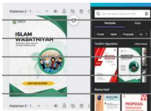
Gambar 1. Tahap Pendesainan Cover Buku Ajar

Tahap berikutnya adalah pengembangan rancangan produk awal berupa pendesainan cover dan animasi yang akan dimasukkan didalam buku ajar menggunakan aplikasi canva sebagai media pendesainannya beberapa komponen yang dapat dilihat pada uraian berikut ini: