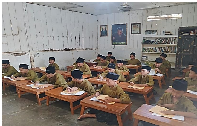
Gambar 1. Kegiatan pembelajaran kitab kuning

Gambar tersebut menunjukkan suasana pembelajaran kitab kuning yang masih berlangsung secara tradisional melalui sistem klasikal dengan posisi duduk berbaris dan penggunaan kitab sebagai sumber utama pembelajaran. Kondisi ini memperlihatkan bahwa pesantren tetap mempertahankan tradisi pendidikan salaf sebagai fondasi pembentukan karakter dan penguatan nilai-nilai keislaman. Di sisi lain, keberlangsungan kegiatan belajar tersebut menunjukkan adanya kesinambungan pendidikan berbasis pesantren yang menjadi bagian penting dari konsep pendidikan berkelanjutan. Temuan ini memperlihatkan bahwa modernisasi pendidikan di pesantren tidak menghilangkan identitas tradisional, tetapi berjalan melalui proses adaptasi yang tetap berorientasi pada nilai, budaya, dan keberlanjutan sistem pendidikan Islam (Ghofur dkk., 2026; Halil, 2022).