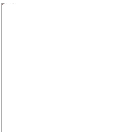
Gambar 3. Kegiatan kewirausahaan santri sebagai implementasi pendidikan berkelanjutan dalam penguatan keterampilan kolaborasi dan kemandirian.

Hasil observasi lapangan menunjukkan bahwa salah satu bentuk implementasi pendidikan berkelanjutan dilakukan melalui kegiatan kewirausahaan santri. Dalam kegiatan tersebut, santri dilatih untuk mengelola usaha sederhana, melakukan kerja sama kelompok, mengatur proses produksi, hingga melayani kebutuhan konsumen di lingkungan pesantren. Kegiatan ini tidak hanya menjadi sarana pelatihan ekonomi kreatif, tetapi juga media pembentukan karakter mandiri, tanggung jawab, dan keterampilan sosial santri.